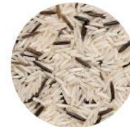
Basmati & Wild Rice Blend